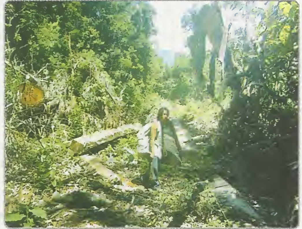
Gambar 1.1 Manusia sebagai khalifah wajib mengelola, merawat dan memanfaatkan alam, tetapi tidak boleh merusak dan menghancurkannya.

وَلَا تُفْسِدُوا فِي الْأَرْضِ بَعْدَ إِصْلَاحِهَا وَادْعُوهُ خَوْفًا وَطَمَعًا إِنَّ رَحْمَتَ اللَّهِ قَرِيبٌ مِّنَ الْمُحْسِنِينَ (الاعراف: ٥٦)